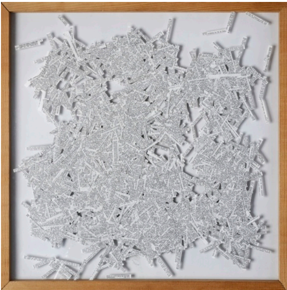
La Bible, anonyme, W La Libertà, 1982