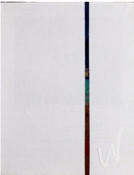
Peinture fermée, 1989

wolman quelques jours en août 1976 affiches restaurées exposition n° il a été tiré par hofer imprimeur et déchiré par wolman artiste peintre 100 expositions de 48 affiches à restaurer et une exposition numérotée 0 restaurée par wolman présentée chez weiller en 1977