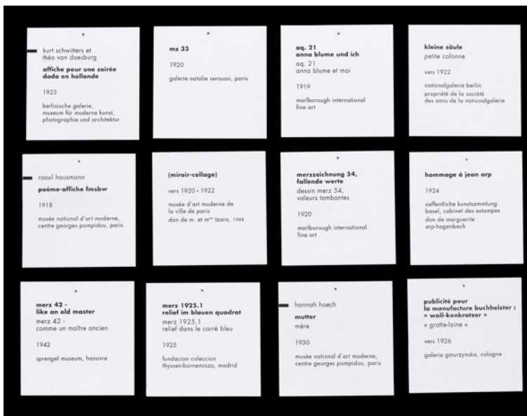
cartels de l'exposition Schwitters

Cette exposition jamais vue est la dernière proposition de l'artiste à se remémorer les oeuvres de Schwitters au Centre Pompidou en 1995.