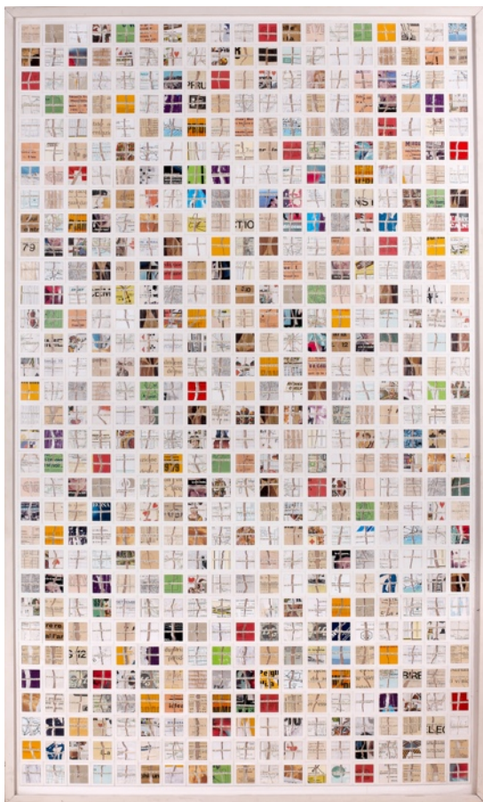
Décomposition, 1979, 164 x 98 cm