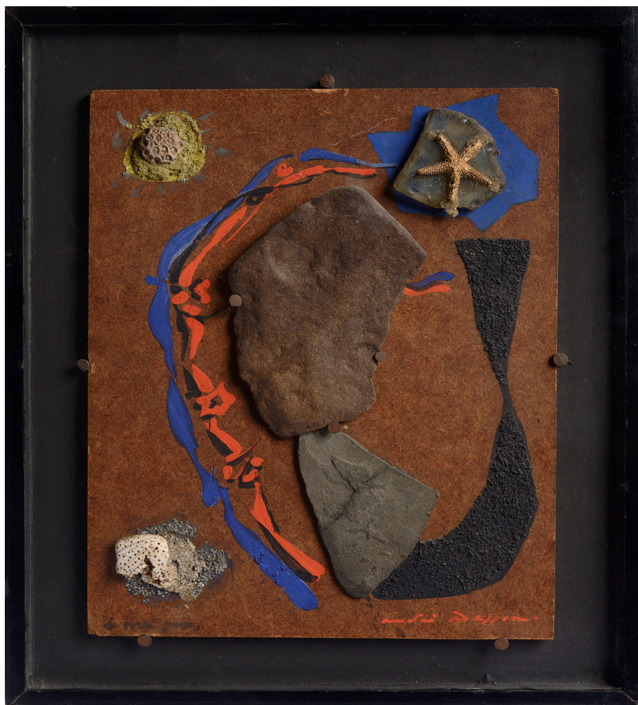
André Masson, Torse aux étoiles , 1942, pierre, coquillages, sable et gouache sur bois, 28 x 21 cm

Dans un espace restreint, sur fond de paysage terrestre, une silhouette aux formes simplifiées semble se mouvoir. À ses côtés, des coquillages, du sable et une étoile de mer sont disposés comme pour mieux souligner l'onirisme de la scène. Par la combinaison d'objets trouvés, de matières naturelles, André Masson parvient à engendrer des images inédites, fantastiques, et ainsi à nous plonger dans un espace incertain, entre terre, ciel et mer.